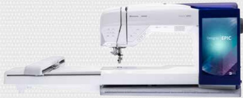
Ontworpen en ontwikkeld in Zweden - MADE FOR SEWERS, BY SEWERS™.

Of u nu naait, borduurt of quilt, de DESIGNER EPIC™ helpt u om uw grootste creatieve ambities waar te maken. We hebben de meest technologisch geavanceerde machine ontwikkeld die toch het meest eenvoudig te bedienen is, inclusief: